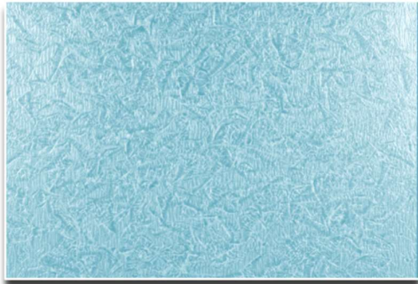
Deco-Stamp Güderi Uygulaması